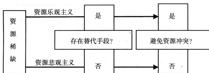
图2 路径依赖的资源关系

替代的行为体容易选择对抗，其结果是，替代手段难以开发，资源冲突也就难以避免，最后将会证实行为体最初的认定。相反，认定资源可替代的行为体容易选择合作，其结果是，可能有时间开发替代手段，资源冲突也就随之避免，从而证实行为体最初的认定。可见，这种路径依赖的现象决定了国家间在资源竞争初期的行为至关重要。