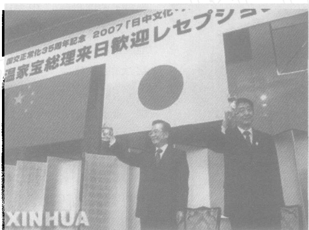
4月12日,温家宝总理与安倍晋三首相共同出席日中友好七团体联合举行的招待会

日本人理解和接受。温总理首先肯定了日本政府和日本领导人多次公开承认侵略,并对受害国表示深刻反省和道歉。同时特别强调:“我们衷心希望日方以实际行动体现有关表态和承诺”。谁都明白,所谓“实际行动”就是指日本领导人不再做参拜靖国神社等伤害中国人民感情的事。日本媒体认为,温总理点到为止,体现了对日方的关照。当温总理表示,对于日本支持与帮助中国现代化建设,“中国人民永远不