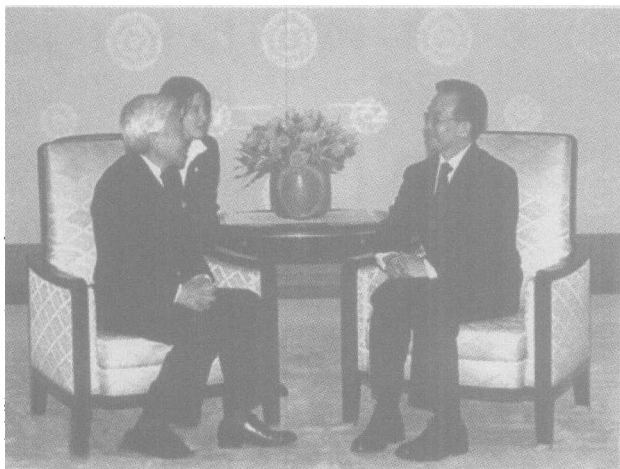
4月12日，温家宝总理会见日本明仁天皇

盾归咎于中方。在台湾问题上，一方面伙同美国牵制中国，制造“中国威胁论”，一方面明里暗里支持“台独”势力与大陆抗衡。在东海问题上，一方面干扰中方在没有争议的中国大陆架开采油气资源，一方面授权日本公司在有争议地区单独勘探开发。