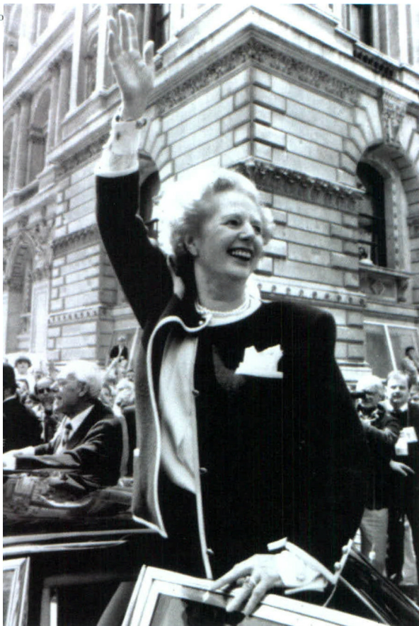
1979年撒切尔夫人当选为英国首相后,大刀阔斧地对经济进行改革,不仅治愈了以“滞胀”为症状的“英国病”,而且使英国经济重回发展巅峰,创造了保守党连续执政18年的记录。图为1987年6月11日,实现三连任的英国首相撒切尔夫人向群众招手致意。

结果保守党接受了工党主张的凯恩斯主义和社会福利政策,使得战后英国政治史上出现了两大党在主要政策上特有的“共识政治”。1951年,保守党重返政府并连续执政13年,很大程度上归功于这次政策的调整。20世纪70年代初,“共识政治”不再奏效,保守党的中坚力量要求改弦易张。1975年,玛格丽特·撒切尔夫人当选为保守党主席,下令成立一个“经济建设小组”,更新党的政策。1977年该小组制定了一份题为《经济成功之路》的文件,放弃了曾影响英国经济政策多年的凯恩斯主义,货币主义成为时尚。1979年撒切尔夫人当选为英国首相,大刀阔斧地推行改革,改革措施包括控制通货膨胀,改革税制,推行市场化、国有企业私有化、削减社会福利,严厉打击工会组织等。