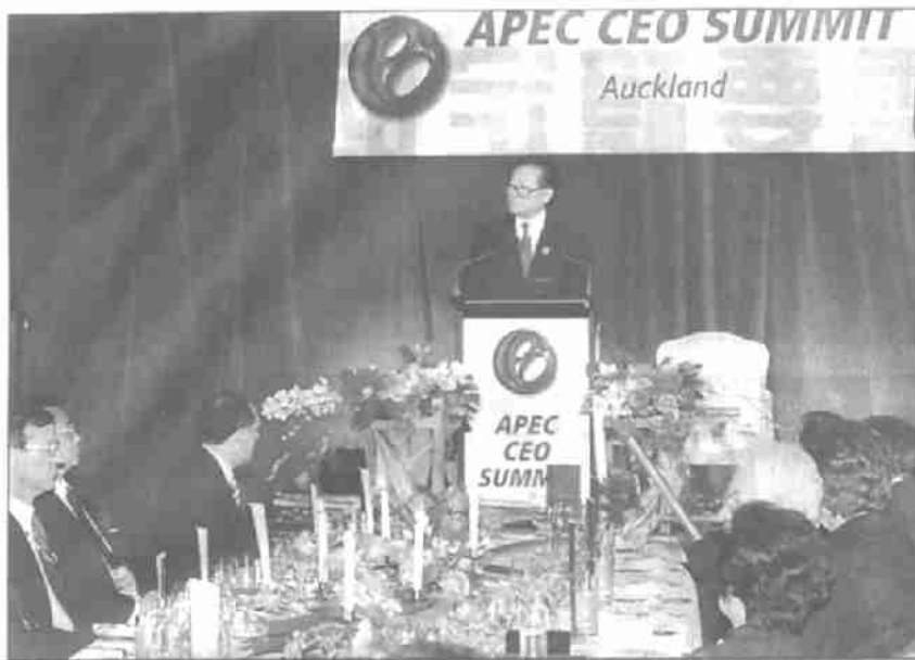
江泽民主席出席亚太经合组织工商界领导人峰会欢迎宴会

复。1997年江泽民主席对美国进行正式访问，终于实现了双边关系的正常化，双方还决定致力于建立“建设性的战略伙伴关系”。然而，1999年美国导弹袭击中国驻南斯拉夫使馆的事件，使两国关系再次陷入低谷。此次中美首脑会谈是使双边关系走出低谷的努力。