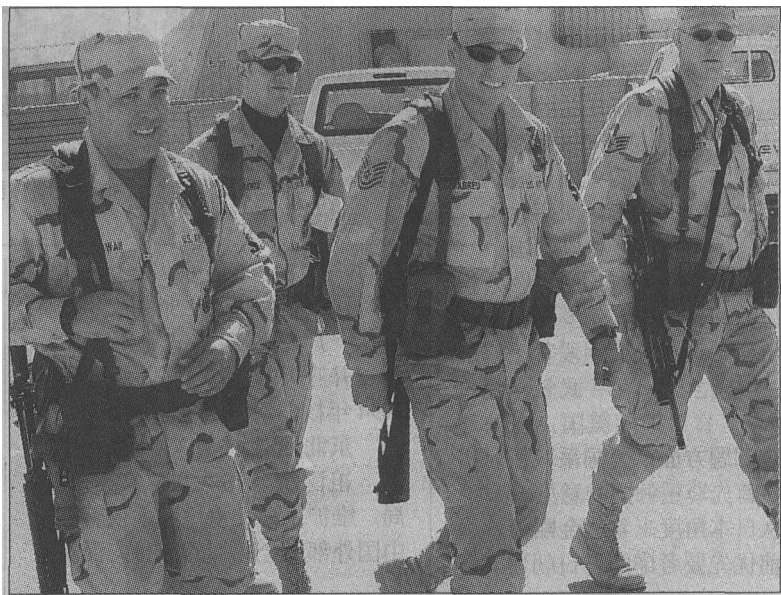
去年十二月二十六日，驻沙特美军官兵庆祝圣诞节

2003年大国政治关系的主要矛盾将主要集中于美国身上，中、俄、欧、日、印之间的政治关系将有所改善。美国的超强实力地位使世界上没有力量可以有效地制约美国的单边主义政策。美国2003年的国防开支将达到4000亿美元，是日、英、法、德、中、俄六国国防开支总和的2倍，因此世界上的主